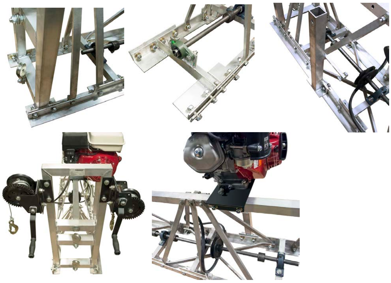
Конечная секция 1,5 м